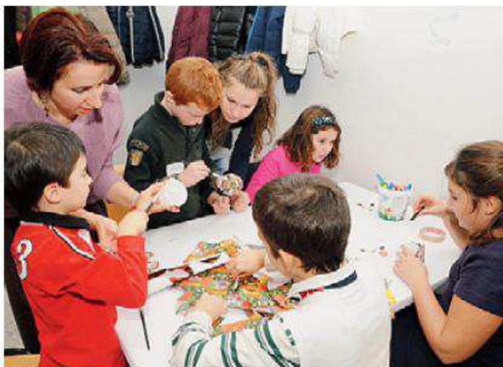
Lo scambio, un momento del mercatino