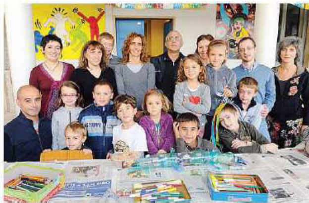
La festa del Baratto ai don Guanella

Con il consueto baratto di giochi libri e fumetti, ma soprattutto con le mani "in pasta". Trattandosi infatti di un compleanno, non poteva mancare certo la torta. Speciale però, fatta di cartone,