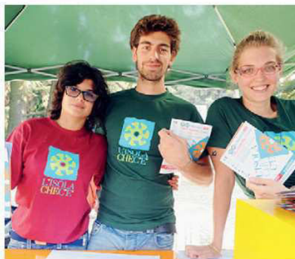
Sopra una foto del pomeriggio di gioco di ieri al Don Guanella, sotto un'immagine d'archivio di alcuni ragazzi de L'Isola che c'è