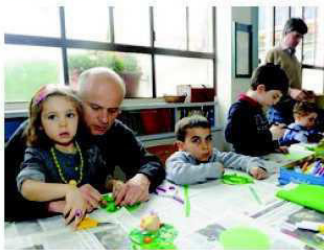
Como Don Guanella laboratorio bambini Bart per decorare le uova di Pasqua

COMO Nell'ambito del progetto "Bart" - per la diffusione della cultura del baratto e dello scambio, dell'educazione alla gratuità, e il reinserimento in circolo di oggetti destinati a diventare rifiuti -, nella sede di via Tomaso Grossi 18 (la Grande corte dell'Opera San Guanella) si è tenuto l'appuntamento settimanale con i laboratori ludico-creativi, ovviamente dedicato alla Pasqua.