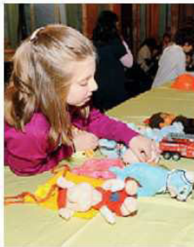
Baratto di giocattoli

Le associazioni "Famiglie in cammino", "L'Isola che c'è" e "Battito d'ali" promuovono il progetto "Bart", per diffondere la cultura del baratto e dello scambio, per educare alla gratuità, e per rimettere in circolo oggetti e impedire che diventino rifiuti. Le iniziative, gratuite e dedicate a bambini e ragazzi, si tengono nella sede di via Tomaso Grossi 18 (nella grande corte dell'Opera San Guanella). Oggi, dalle 16.30 alle 18.30, ludoteca (spazio per giocare in libertà, per bambini dai 6 agli 11 anni). Ogni terzo sabato del mese poi si tiene lo spazio baratto