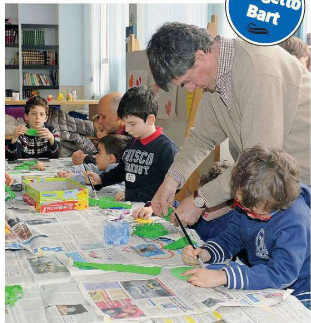
I bambini al lavoro al laboratorio organizzato da Bart al don Guanella

Informazioni e adesioni al Bart, al 334/2656445 e su www.facebook.com/ProgettoBart . G.ALB