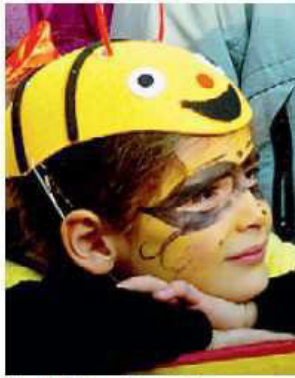
Al via i festeggiamenti

Il primo appuntamento è alle 15 nella grande corte dell'Opera San Guanella (via Grossi 18), per la festa di Carnevale (lettura animata, travestimenti e merenda, per bambini dai 6 ai 10 anni) organizzata nell'ambito del progetto "Bart" (info 334/2656445). Sempre sabato, alla Pinacoteca civica (via Diaz), alle 15, si tiene il laboratorio creativo "Animali in ma-