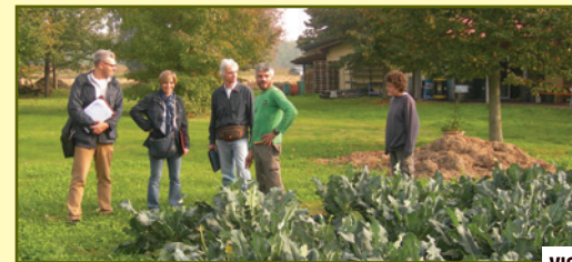
VISITA DEI CAMPI

Da luglio sono state realizzate dai membri incaricati dei Comitati Locali le PRIME VISITE alle aziende agricole aderenti, in estate a quelle ortofrutticole e in autunno a quelle zootecniche (produzione di formaggi da capre e mucche).