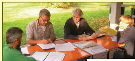
COMPILAZIONE DEL MANUALE DI VISITA

Queste attività sono state realizzate all'interno del progetto “Per una pedagogia della terra” , che a partire dalle pratiche di “filiera corta” e dalle reti diffuse sui territori dei DES di Como, Varese, e Monza, ha sostenuto il percorso di sperimentazione degli SPG accompagnando il lavoro dei comitati locali con l'intervento di animatori locali e di esperti, tra cui Alessandro Triantafyllidis (Presidente AIAB nazionale) ed Eva Torremocha (IFOAM).