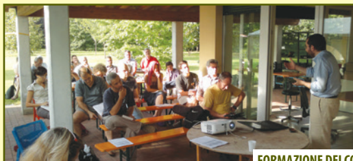
FORMAZIONE DEI COMITATI LOCALI

«I Sistemi Partecipativi di Garanzia (PGS – Participatory Guarantee Systems ) sono sistemi di assicurazione della qualità che agiscono su base locale. La certificazione dei produttori prevede la partecipazione attiva delle parti interessate ( stakeholders ) ed è costruita basandosi sulla fiducia, le reti sociali e lo scambio di conoscenze» (IFOAM, Federazione Internazionale dei Movimenti per l'Agricoltura Biologica , 2008).