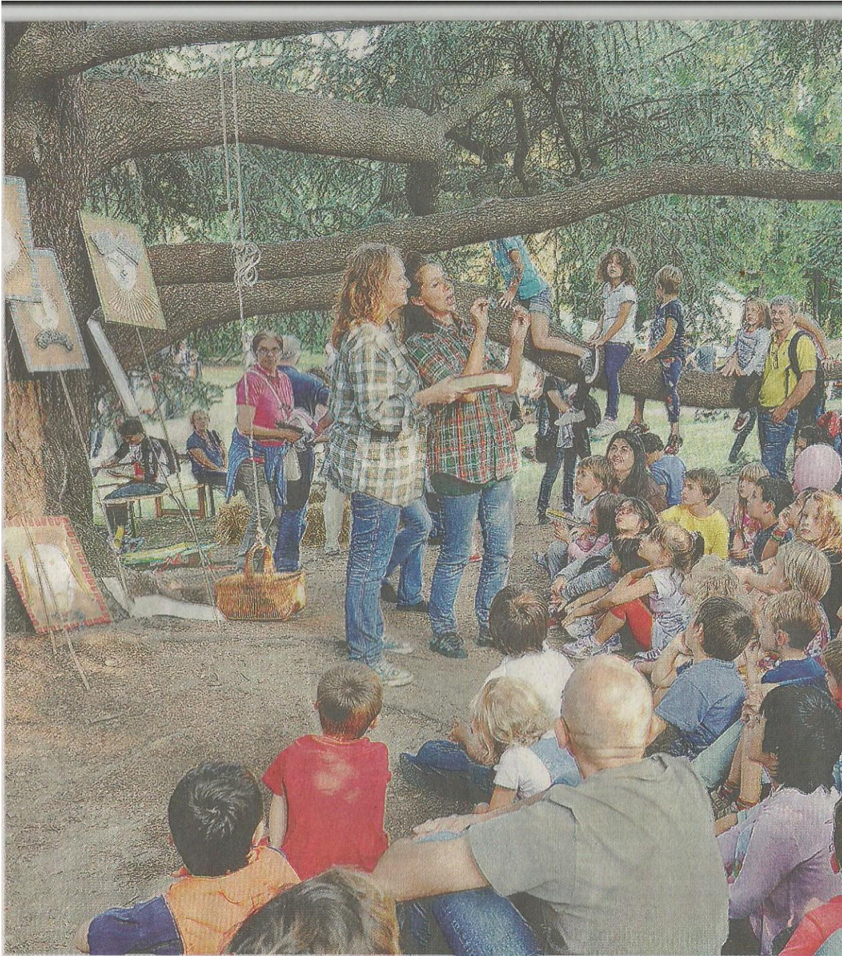
L'isola che c'è, giunta all'undicesima edizione, sarà allestita anche quest'anno nel parco comunale di Villa Guardia