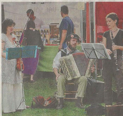
L'Isola che c'è, sabato e domenica al parco comunale di Villa Guardia

Sabato mattina alle 10.30 presso lo Spazio dibattiti (tendone area Equo), infatti, si terrà un incontro dedicato alla sicurezza e alla prevenzione delle truffe ai danni delle persone anziane, organizzato da Ausser, Ada e Antea, mentre alle 14.30 il mondo del volontariato, dei servizi e delle istituzioni si interrogherà sul tema "Separati in