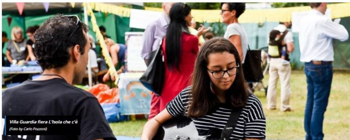
Villa Guardia fiera L'Isola che c'è

HOME / CRONACA / "L'ISOLA CHE C'È", UN SUCCESSO «UN MONDO MIGLIORE SI PUÒ»