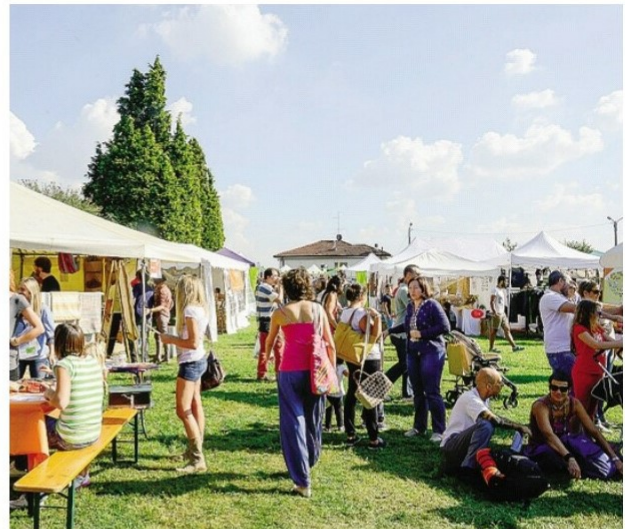
Come ogni anno l'appuntamento è al parco Garibaldi di Villa Guardia