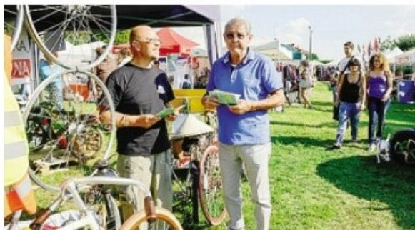
Tra gli stand alla fiera in programma il 17 e il 18 settembre

merevoli collaborazioni innescate in questi anni tramite i contatti e le informazioni ottenute». In occasione dei suoi 25 anni di attività filantropica, Fondazione Cariplo ha deciso di dare visibilità ai progetti più significativi sostenuti con passione e impegno dal 1991. Fra questi compare L'Isola che c'è, omaggiata dal video "Lunga vita alla filiera corta" che ne racconta la storia.