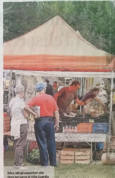
Oltre 180 gli espositori alla fiera nel parco di Villa Guardia