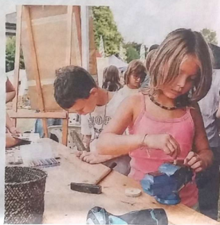
Tante le attività per i bambini in quest'edizione della fiera

Età, lingua, colore della pelle, orientamento sessuale, estrazione sociale e religione: non importa chi tu sia, il principio di base che ha reso grande la fiera, giunta alla sua 131ma edizione, è la convinzione che ognuno può aggiungere valore. Mani che si stringono, occhi che si guardano, adulti e bambini che si abbracciano in uno spazio che è momento di incontro e di confronto, dove diverse sensibilità e modi di pensare generano creatività e cambiamento.